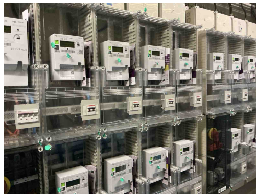
Geen gekoppelde inbreuk