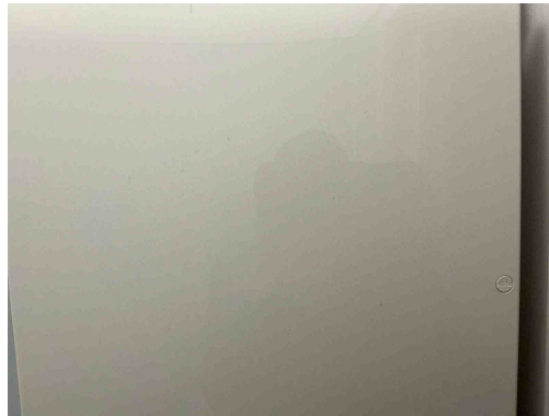
Geen gekoppelde inbreuk