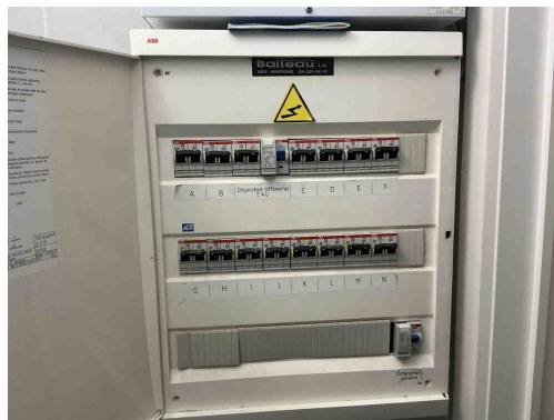
Geen gekoppelde inbreuk